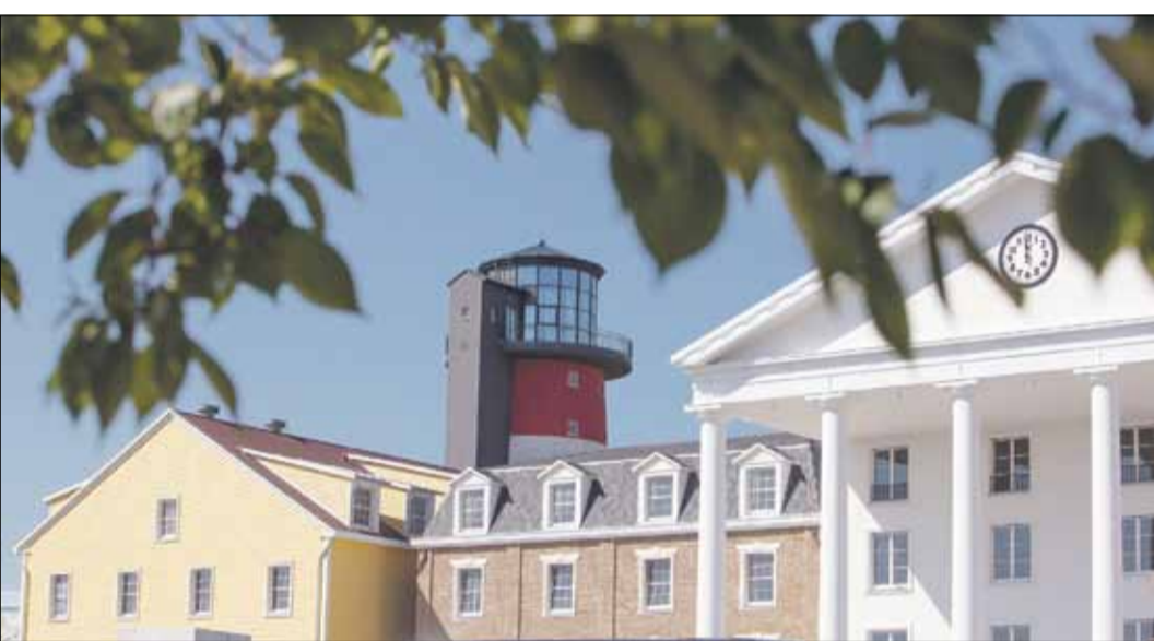
Neuengland in Südbaden: Ab Juli können sich die Besucher im neuen Erlebnishotel Bell Rock auf die Spuren der Pilgerväter und Entdecker begeben.

Martin Neumeier: Das heißt, wir haben zunächst intensiv an der Inszenierung eines Themas gearbeitet und nach einem Ansatz gesucht, der nachhaltig tragfähig ist und auch eine spannende Geschichte in sich trägt. Das Konzept musste in den Gesamtkontext Europa-Park passen und sollte zugleich etwas ganz außergewöhnliches Neues sein. Dabei mussten wir anfangs einige Haken schlagen, aber das hat sich letztlich gelohnt.